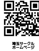
埼玉サークル ホームページ

8月5日(土) 14:00~16:50 与野本町コミュニティセンター視聴覚室兼会議室 (JR埼京線 与野本町駅西口下車徒歩5分 電話(048)853-7232)