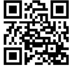
埼玉サークル ホームページ