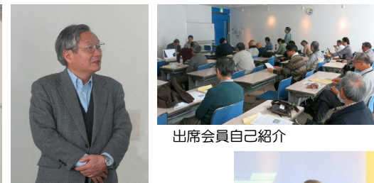
出席会員自己紹介