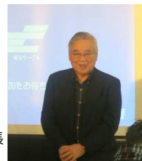
ごあいさつ 高井前東京支部長