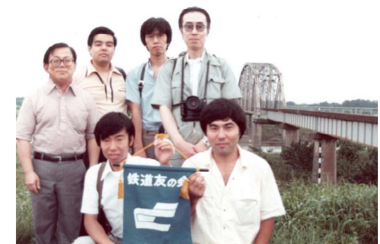
1983. 8. 21 荒川橋りょう

ただ今年は大変残念なことです。新型コロナウイルスでこの埼玉サークルの伝統行事が実施できるのか危ぶまれています。