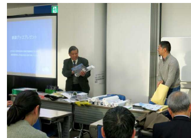
鉄道グッズプレゼント