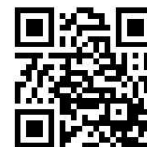
埼玉サークル ホームページ

恒例の忘年会は、コロナ禍であり飲食を伴うことから大変残念ではありますが、今年は開催を中止とさせていただきます。申し訳ございません。